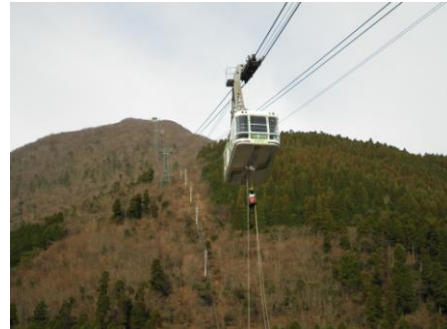
搬器乗客救助訓練 地上約40M